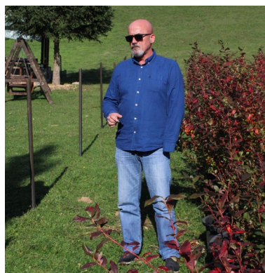
Buone prassi di Economia Sociale

L'Associazione degli Amputati di Sarajevo Est - UDAIS, e l'Organizzazione Giovanile "NATURA" hanno realizzato un'iniziativa che riguarda lo sviluppo di piantagioni inclusive di mirtili americani, il cui obiettivo è la creazione di un ambiente sociale che favorisca migliori opportunità occupazionali e la creazione di nuovi posti di lavoro per persone con disabilità e giovani disoccupati dell'area della città di Sarajevo Est.