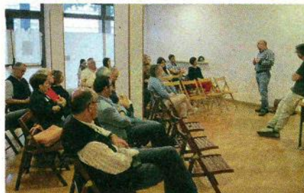
Nelle foto l'interno della Locanda, dormitorio aperto in largo San Giovanni, e gli operatori e i volontari che garantiscono il servizio

ASILO NOTTURNO Aprire alle 19 e chiudere alle 8.30: garantiti camera con bagno, cena, colazione e la possibilità di lavare i propri indumenti