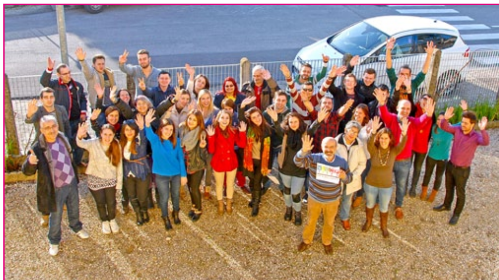
Foto di gruppo dei partecipanti al progetto Wosocoop. Casarsa della Delizia 25 gennaio - 01 febbraio 2015