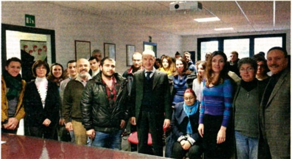
Wosocoop, il progetto del Consorzio Leonardo ha portato quaranta giovani da tutta Europa a scoprire la cooperazione sociale del Friuli occidentale