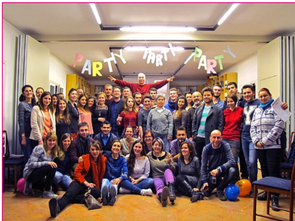
Festa finale della settimana di Wosocoop